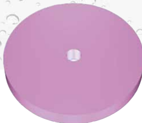
Cuadro esquema 1